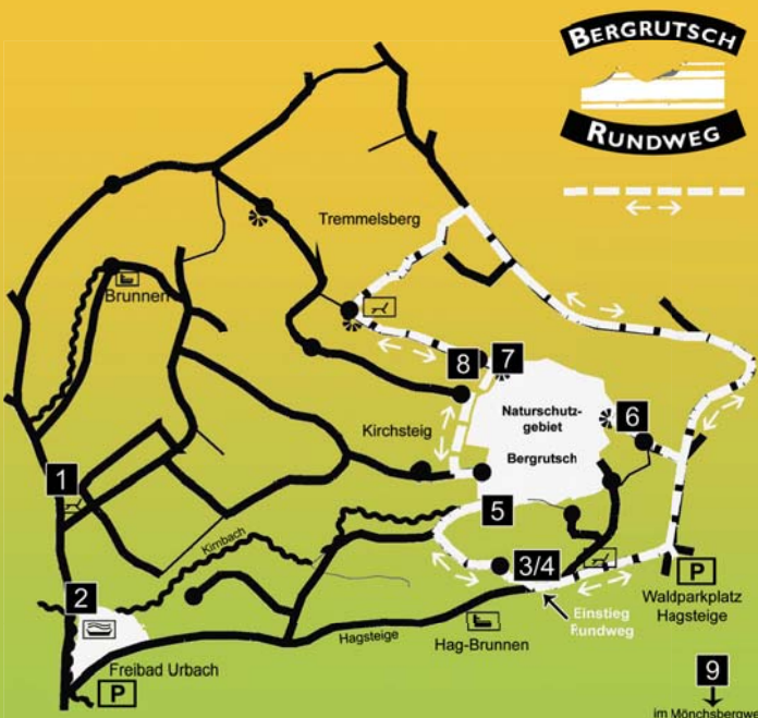
Verlauf des Rundweges mit Standorten der Informationstafeln

Dieser umfasst auf einer Strecke von rund drei Kilometern und 95 Höhenmetern insgesamt sechs Informationstafeln, die dem Besucher nicht nur den Berggrutsch am Kirchsteig und dessen geologischen Zusammenhänge näher bringen, sondern auch die natürlichen Besonderheiten dieses Gebiets mit seiner reichhaltigen Tier- und Pflanzenwelt. Drei weitere Tafeln außerhalb des Rundweges informieren über Kulturhistorisches.